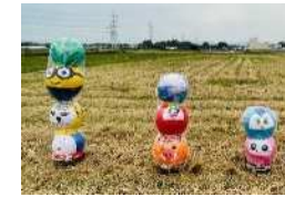
奥富かかしまつりへの作品出品