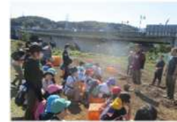
オアシス作業所さんともほり活動