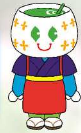
学校キャラクター ちやこちゃん

保護者・地域と共に連携・協働し、子どもの将来を見すえて実践を確実に積み重ねていく学校