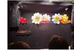
人形劇オツペさんによる人形劇鑑賞