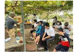
狭山ぶどうの里さんでの柿狩り