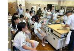
狭山蕎麦文化研究クラブさん そば打ち体験